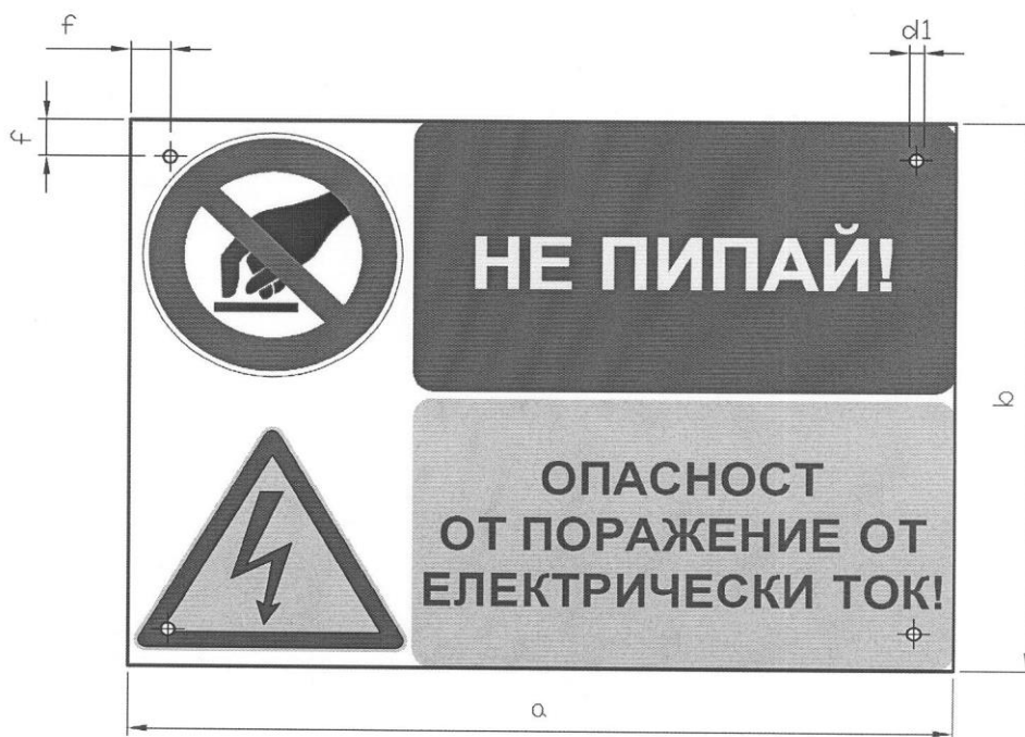
Фиг. 2 Табела „Не пипай! Опасност от поражение от електрически ток!“